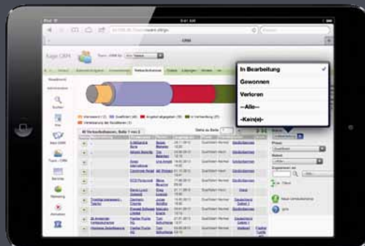
Die Vertriebspipeline bequem analysieren und steuern.